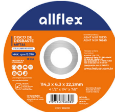
Disco de Desbaste Metal 3 Telas Super Resistentes 4 1/2" x 1/4" x 7/8"

O disco de corte para aço inox é uma ferramenta essencial projetada especificamente para o corte eficaz e preciso de aço inoxidável. Fabricado com materiais de alta qualidade, este disco garante uma excelente resistência ao desgaste e uma vida útil prolongada, mesmo sob uso intenso.