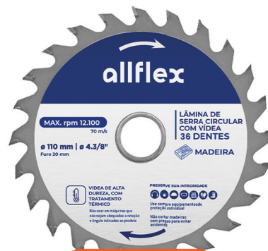
Disco Serra Circular 7.1/4 36 Dentes