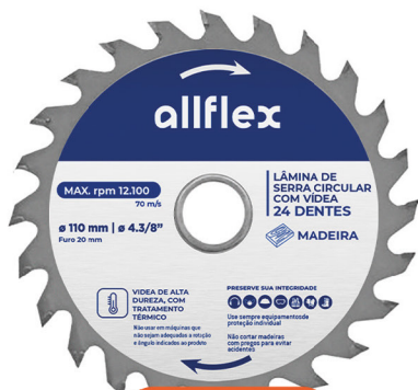
Disco Serra Circular 4.3/8P 24 Dentes