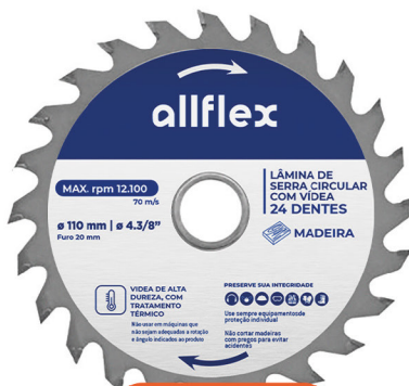
Disco Serra Circular 7.1/4 24 Dentes