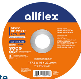
Disco de Corte Aço Inox 2 Telas Super Resistentes 7" x 1/16" x 7/8"